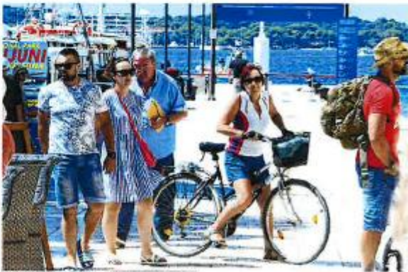
Glavni gospodarski adut mješta je turizam

bila nikakva. Temelj svega bi- la je naša povijest i tradicija koju smo željeli pokazati i turistima, ali i mještanima, s obzirom da nije bila vidljiva. Podigli smo je na površinu i napravili znakovitu izložbu «Fažana ispod pločnika» ko- jom je predstavljena 2000 go- dina stara povijest. Predstavili smo i sve ono kulturne materijalno i nematerijalno blago i tradiciju malog ribarskog mješta. Kroz naredne godine smo to i dodatno razvijali. Ali bez potpore mještana ništa od