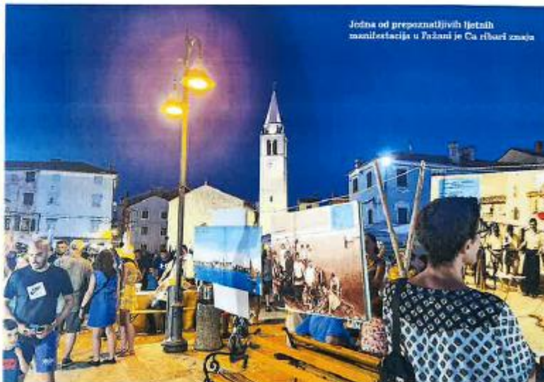
Jedna od prepoznatljivih ljetnih manifestacija u Fažani je Ča ribarji zvonja

Svjesni smo da je Fažana bila gospodarsko središte u vrijeme Rima - od tvornice amfora, preko uljara, do 17 rimskih vila, i da bi sve to bilo dobro prezentirati. Arheološki muzej Istre ima jako puno artefakta s našeg područja, poput amfora, pa je Općina donijela odluku da zaokružimo Rimsku stazu Vasianum interpretacijskim centrom u nekadašnjoj vodospremi preko puta Vile San Lorenzo. Idejni projekt je već napravljen i to bi se, po meni, moglo dogoditi već iduće godine